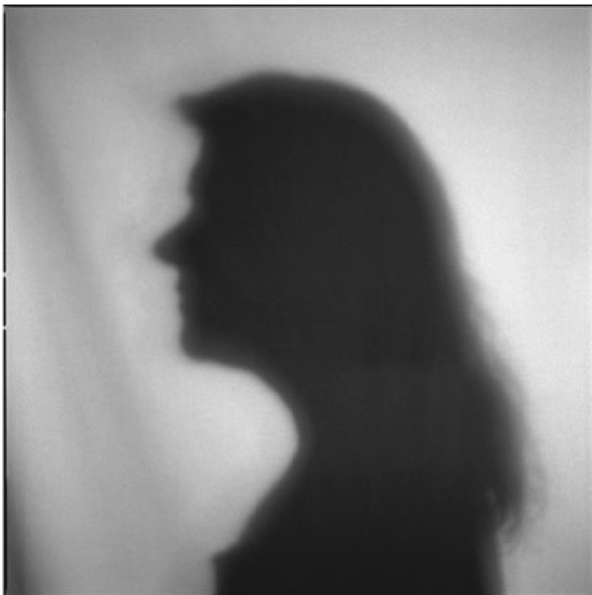
“Untitled” (2008), Eurico Lino do Vale